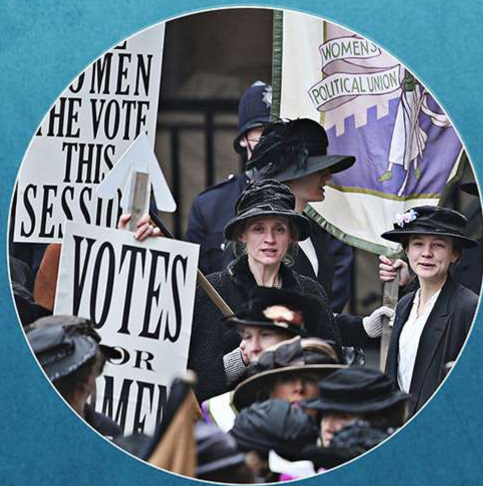
LES SUFFRAGETTES (2015)

SALLE DES FÊTES *** 37160 CIVRAY-SUR-ESVES