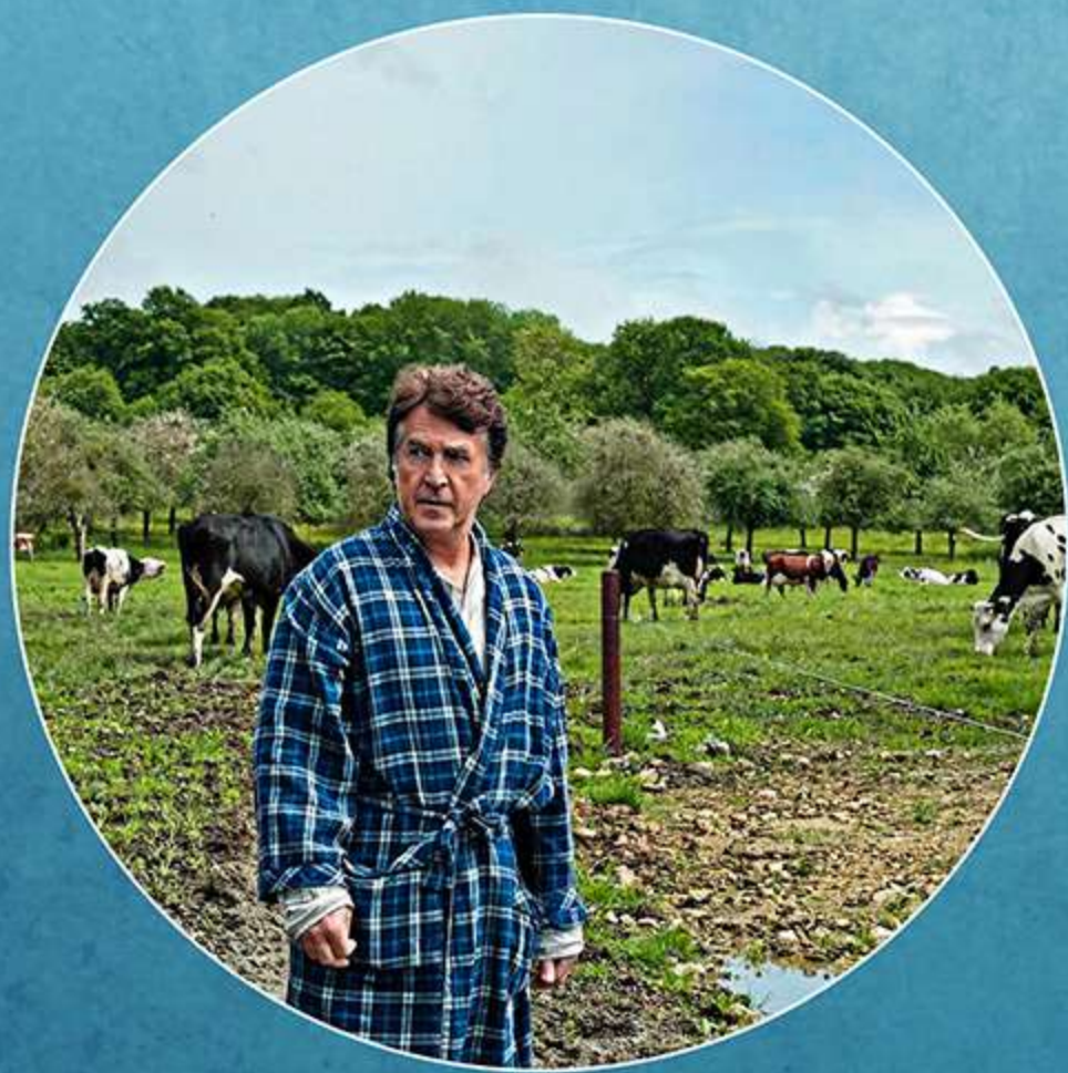
NORMANDIE NUE (2018)